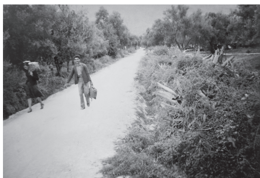
Local people on 42nd Street/Tsikalarioon in 1945. Ντόπιοι κάτοικοι στη 42η Οδό/Τσικαλαριών το 1945.