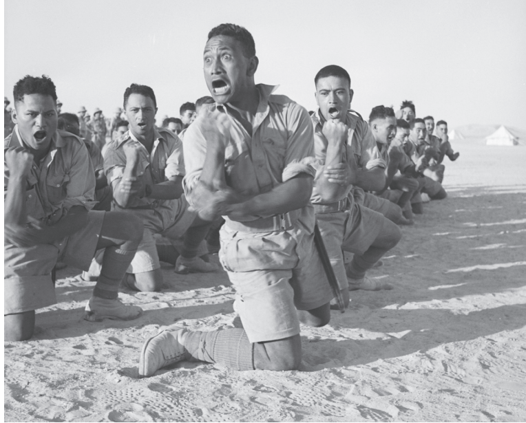
25 June 1941. Less than a month after the battle at 42nd Street, troops of New Zealand 28 (Maori) Battalion (C Company) perform a haka for the King of Greece in Egypt.